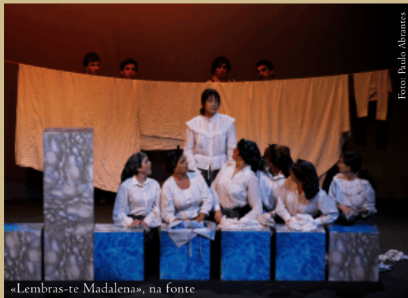
«Lembras-te Madalena», na fonte

Por isso, siga o nosso conselho: namore durante toda a vida, mesmo depois de casados, mantendo acesa a chama da paixão. Até porque, segundo os médicos, faz bem à saúde!