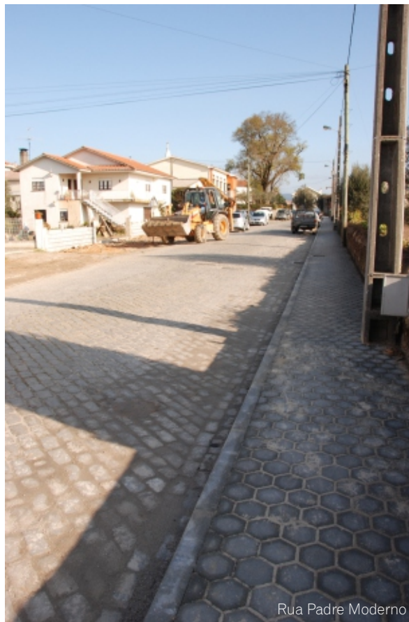
Rua Padre Moderno

Para além dos benefícios em termos de segurança de peões e ordenamento do trânsito, estas intervenções contribuem também para a requalificação urbana de duas vias estruturantes no acesso ao centro da Vila de Mortágua. ■