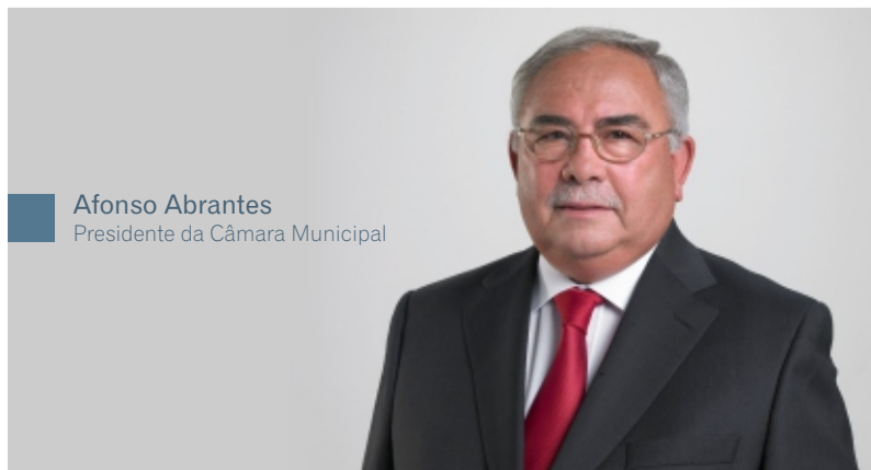
Afonso Abrantes Presidente da Câmara Municipal

As questões sociais e educacionais são objeto de constante preocupação do Município de Mortágua que, sempre que fatores especiais da economia local ou nacional o exigem, tem implementado políticas específicas que eliminem e/ou atenuem os problemas que daí advêm.