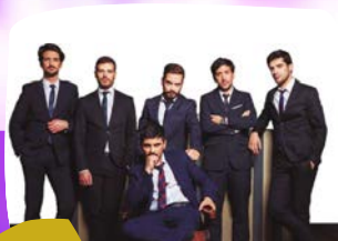
14 QUATRO E MEIA