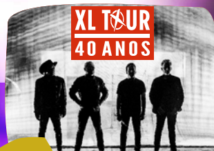
15 XUTOS & PONTAPÉS