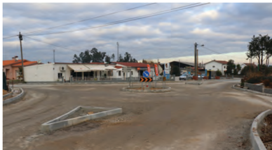
REMODELAÇÃO DE CRUZAMENTO EM VALE DE AÇORES