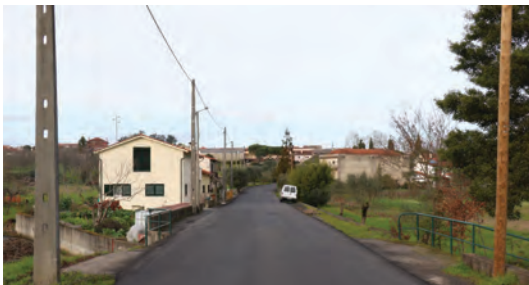
BENEFICIAÇÃO DA E.M. VALE DE AÇORES - PINHEIRO