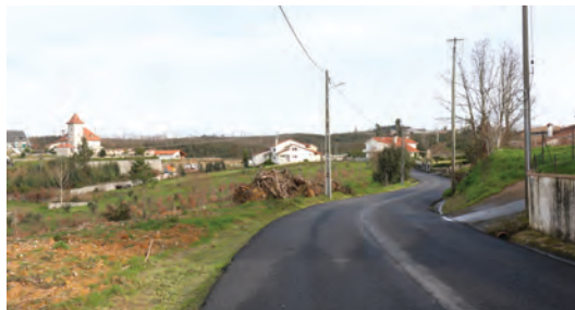
BENEFICIAÇÃO DO ACESSO AO BARRIL, A PARTIR DA E.N. 228