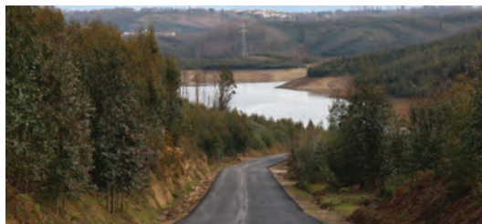
BENEFICIAÇÃO DA E.M. CHÃO DE VENTO - ALBUFEIRA DA AGUIEIRA