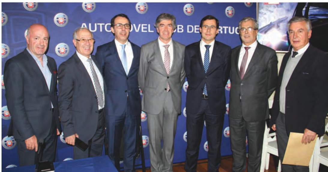
CERIMÓNIA DE APRESENTAÇÃO DO RALI DE PORTUGAL