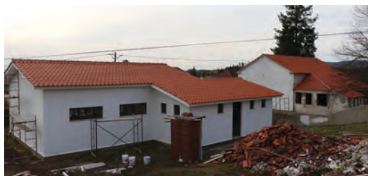
RECONVERSÃO DAS ESCOLAS DA FELGUEIRA