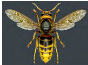
VESPA CRABRO