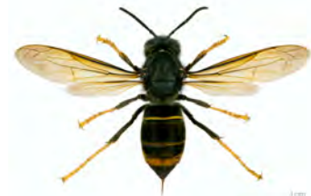
VESPA VELUTINA