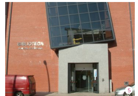
1. Praça do Município